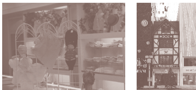
三世代目の店舗もチューダー様式で設計された